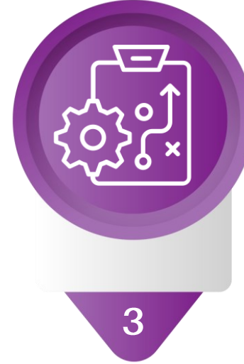
3 Strategic Planning التخطيط الاستراتيجي