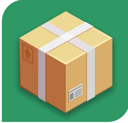
Fixed Package حزمة ثابتة