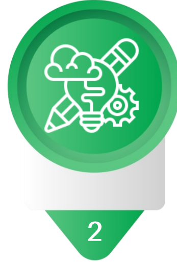
2 Strategic Design & Formulation التصميم الاستراتيجي والصيغة