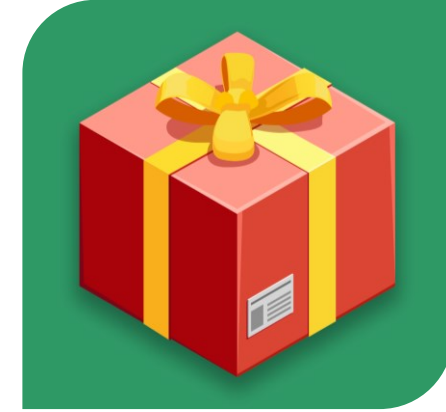
Track (Strategy Academy) حزمة مخصصة

Strategy Implementation challenges faced by Implementers تحديات تنفيذ الاستراتيجية التي يواجهها المنفذون