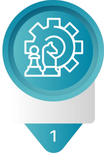
1 Strategic Thinking التفكير الاستراتيجي