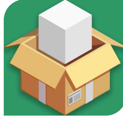
Customized Package حزمة مخصصة

Top Strategy Implementation Challenges أهم تحديات تنفيذ الاستراتيجية